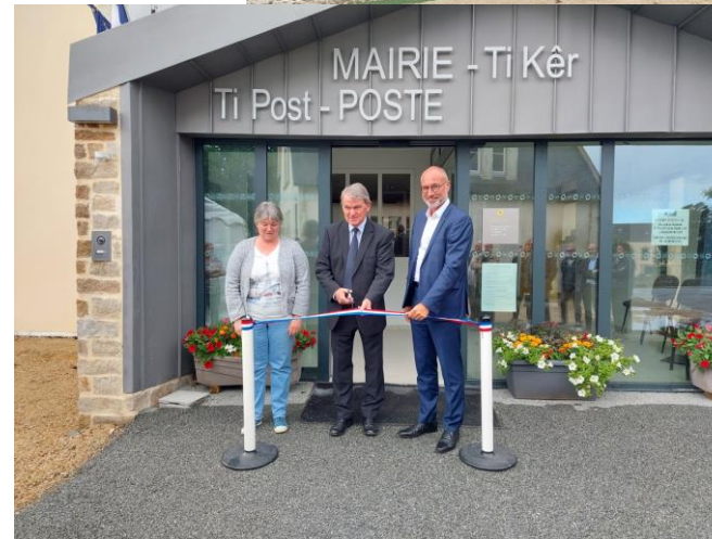
Inauguration de la nouvelle Mairie / Poste (Mai 2022)