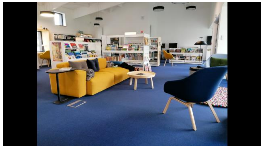
Inauguration de la médiathèque communautaire Mouezh ar Galon (Mai 2022)