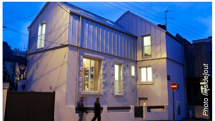
RENNES (35) Sur-élévation In[side]out architectes, 2015