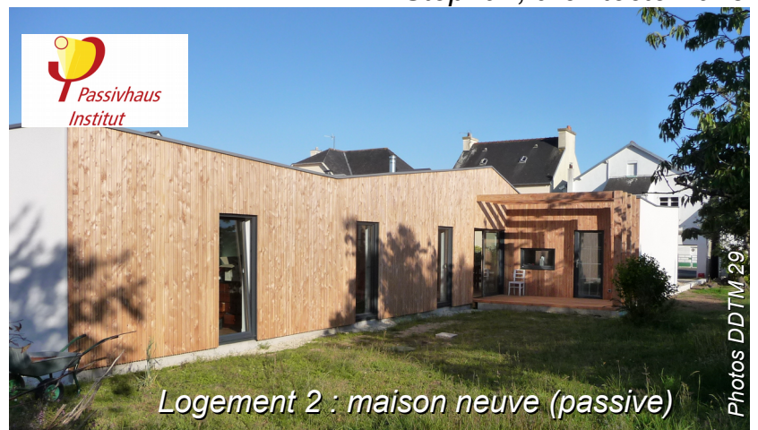
Logement 2 : maison neuve (passive)