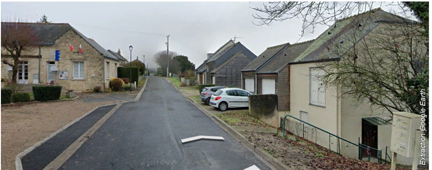
CHINON (37) Lotissement de bourg (multi-sites) Lucien KROLL architecte, 1985