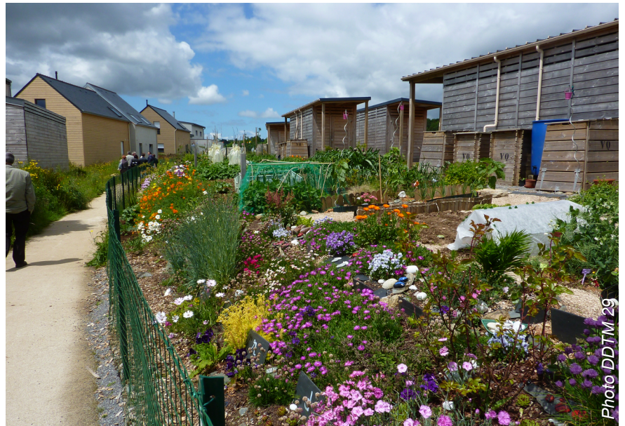
QUIMPER (29) « Villa Gaïa » 20 maisons locatives Aiguillon construction, 2016

Passer du « lotissement » à « l'éco-lotissement » Qualité des espaces communs Diversité et cohérence Nature et biodiversité Mobilités douces Éco-construction