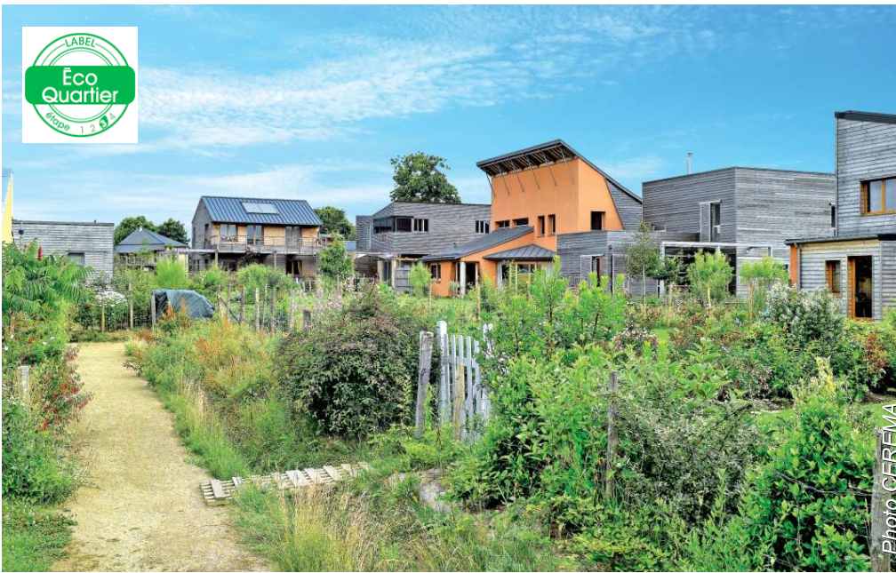
HÉDÉ-BAZOUGES (35) Eco-lotissement communal 35 lots + 10 logts sociaux B. Menguy & G.Le Garzic arch, 2014

Passer du « lotissement » à « l'éco-lotissement » Qualité des espaces communs Diversité et cohérence Nature et biodiversité Mobilités douces Éco-construction