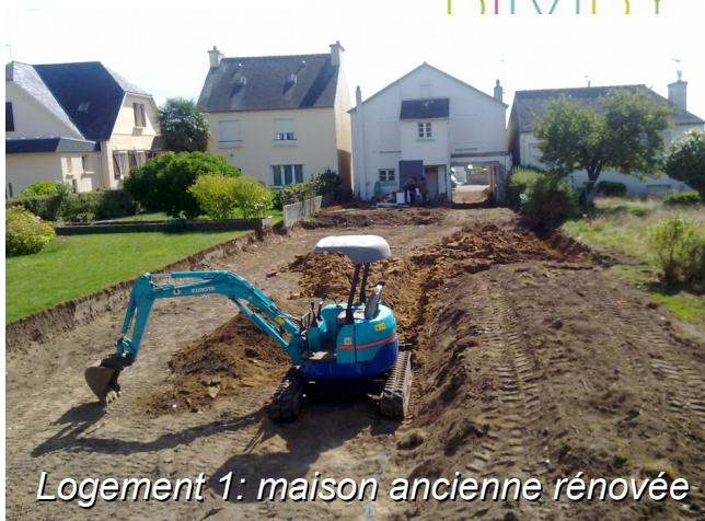
Logement 1: maison ancienne rénovée