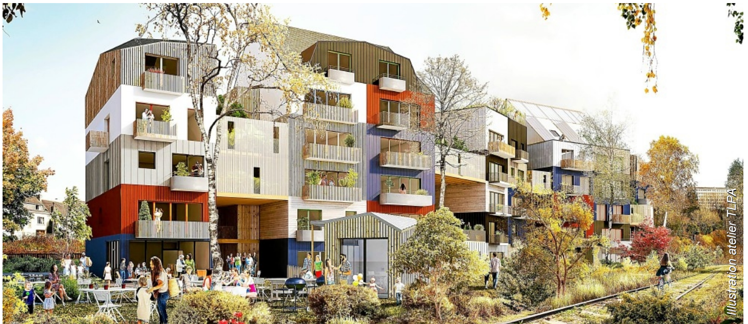
Illustration atelier TLPA