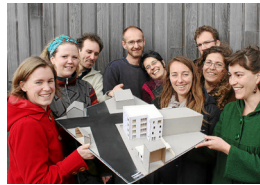
BREST (29) 6 logements + locaux & services mutualisés SCI « Ekoumène » Indigènes, N.Lachèvre et A.Bodilis, arch, 2015